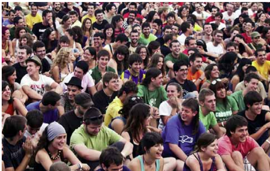
Més de 7.000 assistents al Feslloch'10

En la darrera edició del Festival Itinerant de Música en Valencià, Escola Valenciana i l'entitat de joves federada Reviscola ha treballat en els concerts que van acabar amb el Feslloch, el festival de tres dies de música que en la passada edició va comptar amb més de 7.000 assistents a la població valenciana de Benlloch.