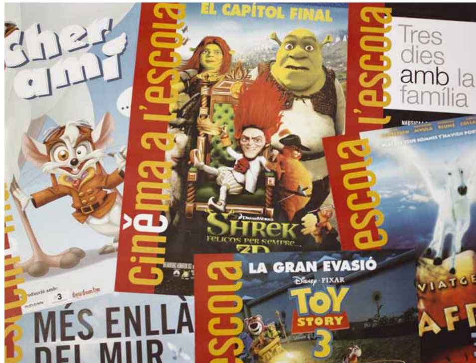
Cartells de la darrera edició del Cinema a l'Escola

Des de l'any 2006, quan es creà el departament d'audiovisuals de l'entitat, s'ha avançat a passos de gegant en la gestió d'aquest camp. En poc de temps s'ha creat la base per a la proliferació del cinema i altres formats audiovisuals en la nostra llengua. Una prova d'això és que Escola Valenciana és una de les entitats que col·laboren i donen suport des de la seua primera edició al Festival Inquiet, l'únic festival de cinema on participen produccions de versió original en la nostra llengua i on cada cop té més presència una secció dedicada als treballs audiovisuals fets per escoles i instituts.