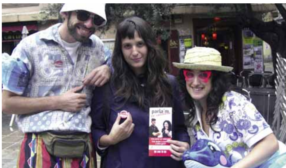
'Guerrilla' del Voluntariat pel Valencià

L'efectivitat de la campanya està més que comprovada. En les dues edicions anteriors l'increment de voluntaris i aprenents ha estat espectacular. Durant les dues setmanes que sol durar la difusió publicitària les altes es tripliquen. Enguany s'ha adaptat aquest model de campanya per fer difusió publicitària i comunicativa també en l'àmbit local i comarcal en poblacions interessades on el programa ja està establert o s'estableix de nou.