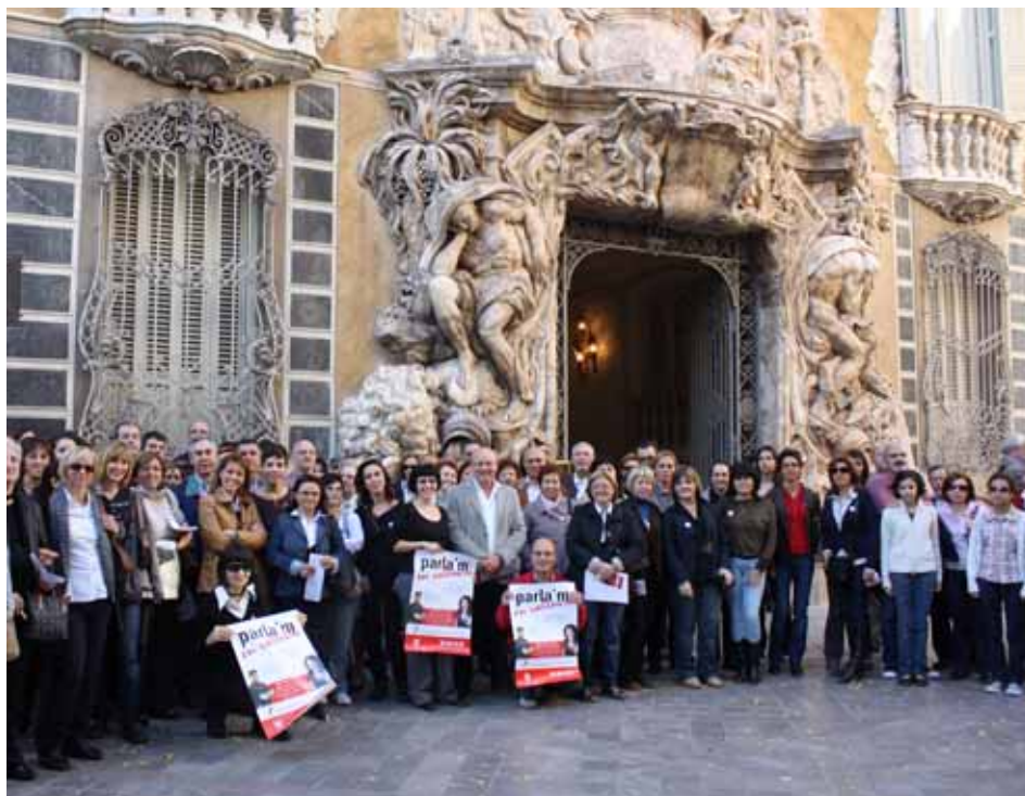
Trobada entre voluntaris i aprenents

Les passejades culturals tenen cada cop més èxit entre les persones que participen al Voluntariat pel Valencià.