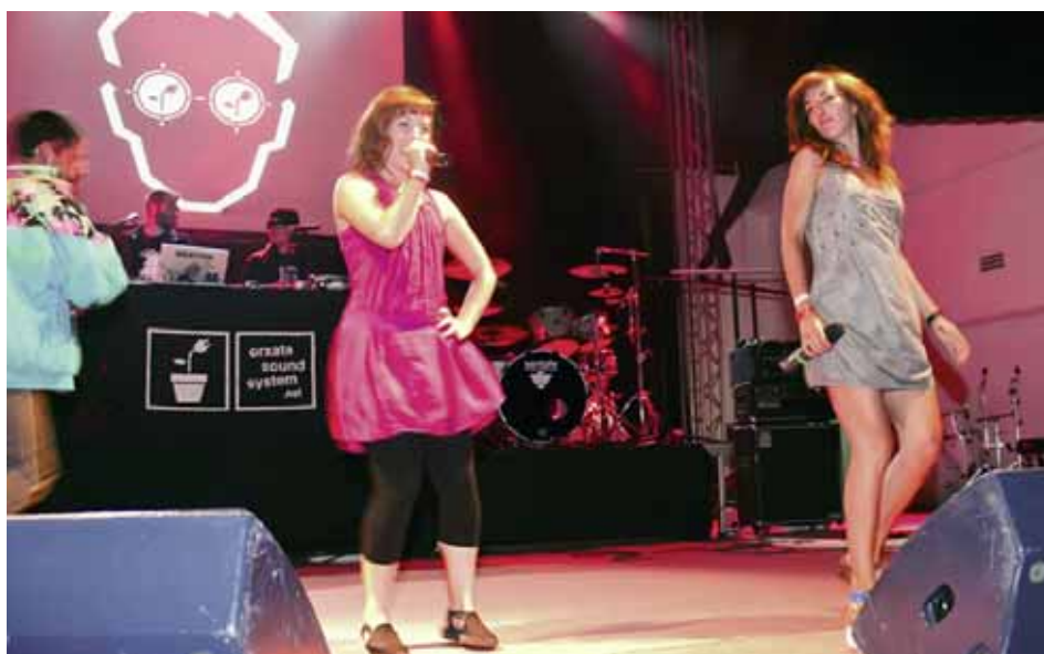
Orxata Sound System, un dels grups que participen en La Gira 2011

Després d'haver celebrat sis edicions, La Gira acumula xifres rècord en el panorama musical català. En aquests cinc anys La Gira d'Escola Valenciana ha mobilitzat als més de 120 concerts que ha realitzat, més de 130.000 joves que han gaudit de la música en valencià i ha editat també més de 100.000 exemplars dels cinc volums del disc de La Gira. Xifres històriques que demostren la bona salut de la música feta en la nostra llengua. Només en l'edició de 2010 ha tingut més de 30.000 assistents en els 25 concerts que s'han celebrat de març a juliol.