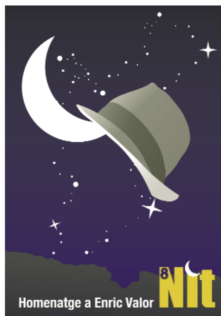
Imatge de la vuitena Nit