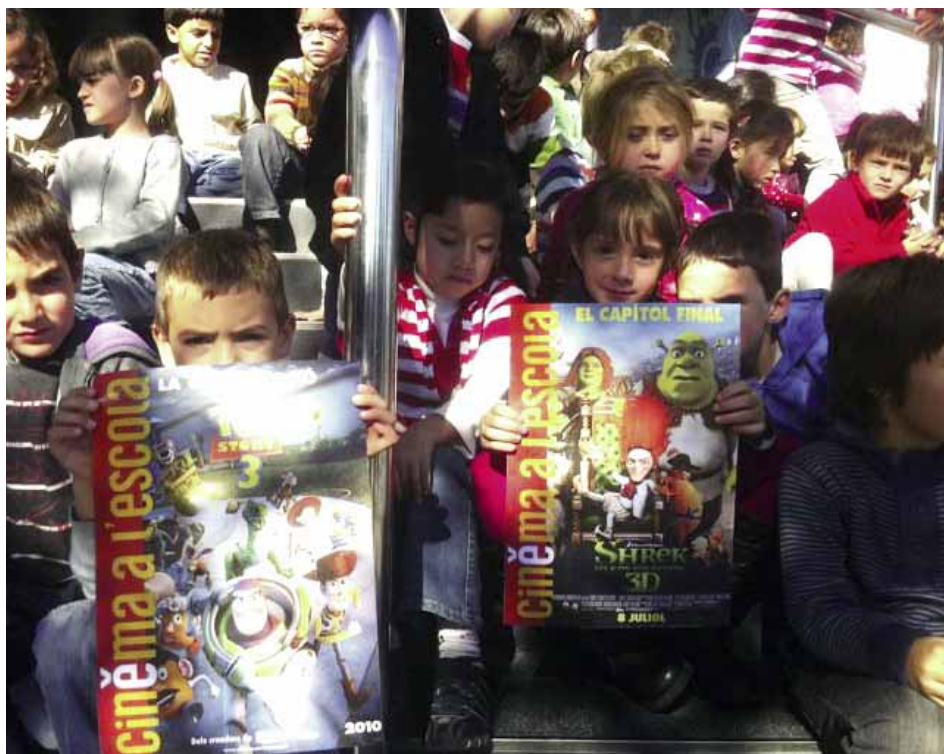
Alumnes assistents a les projeccions

Les pel·lícules que s'han seleccionat en aquesta edició han estat: Shrek 4 , Toy Story 3 , Viatge Màgic a l'Àfrica , Cher Ami , Tres dies amb la Família , Pa Negre , Més Enllà del Mur , Mauthausen-Gusen: la memòria i Joanot i Tirant , Lletres i Batalles . Totes les pel·lícules compten amb guies didàctiques per treballar a classe. Els criteris de selecció de les pel·lícules atenen a l'actualitat dels títols i a la temàtica que tracten. Aquesta programació permet arribar a tots els cicles educatius des d'infantil fins a batxillerat. Els títols de producció valenciana són documentals que van dirigits fonamentalment als instituts.