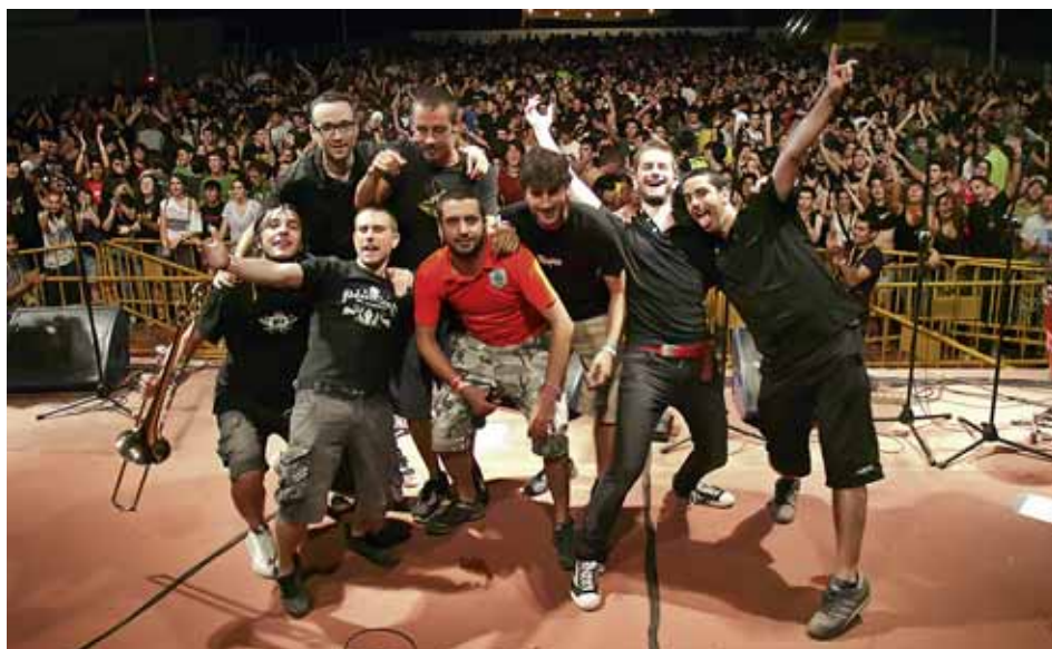
Obrint Pas va actuar al Feslloch'10

En la darrera edició del Festival Itinerant de Música en Valencià, Escola Valenciana i l'entitat de joves federada Reviscola ha treballat en els concerts que van acabar amb el Feslloch, el festival de tres dies de música que en la passada edició va comptar amb més de 7.000 assistents a la població valenciana de Benlloch.