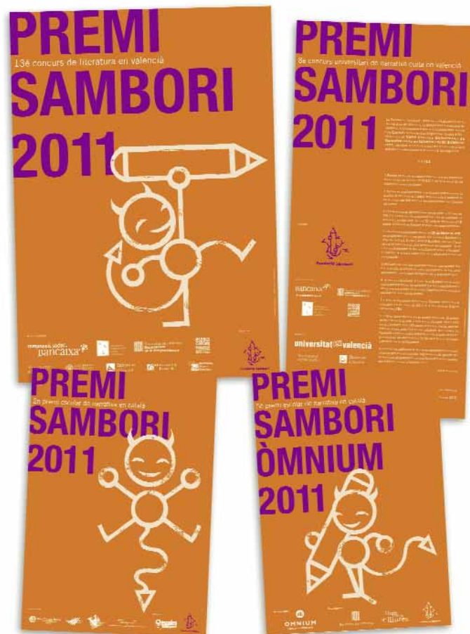
Cartells de les diferents convocatòries del Premi Sambori 2011

El Premi Sambori es consolida enguany a les Illes Balears, gràcies a la coordinació amb el Moviment d'Escoles Mallorquines i el suport de l'Obra Cultural Balear, Joves de Mallorca per la Llengua, l'Associació Pitiüsa per a la Renovació Pedagògica i el Moviment de Renovació Pedagògica de Menorca. A Catalunya es celebra ja la cinquena edició del Premi Sambori Òmnium, gràcies a la coordinació amb Òmnium Cultural.