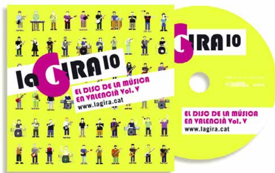
Portada del CD de La Gira 2010

A més, Escola Valenciana i Reviscola han editat amb la col·laboració de la Universitat de València, la Universitat d'Alacant, la Universitat Politècnica de València, la Universitat Jaume I de Castelló, la Universitat Miguel Hernández d'Elx i el Col·lectiu Ovidi Montllor de Músics i Cantants en Valencià (COM) el CD de La Gira'10, el disc de la música en valencià volum V. Aquest disc recopilatori recull 22 cançons de 22 grups i solistes diferents, que han participat a La Gira'10 i algunes novetats musicals llançades recentment al sector de la música en valencià. D'aquest disc s'han editat 30.000 exemplars. Durant els 80 minuts de durada del disc es poden trobar diferents estils de la música en valencià actual, des del rap , al reggae , la cançó d'autor, el punk-rock , l' ska , el pop independent, la música electrònica, etc.