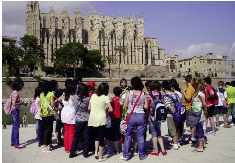
Acosta't al Territori visitant la ciutat de Palma

Es tracta d'una invitació al passat de cada ciutat o poble valencià que permet entendre millor el seu desenvolupament al llarg de la història.